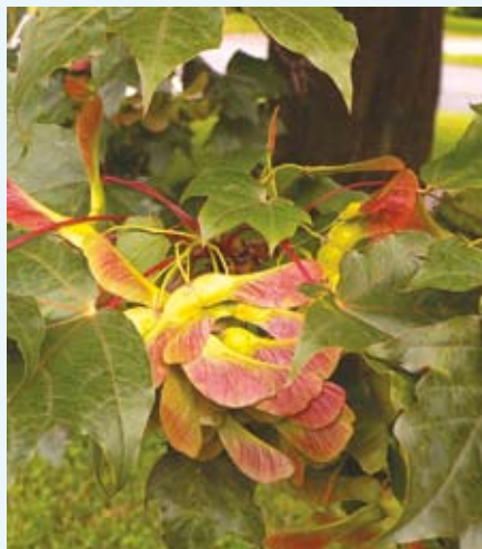
Klon pospolity odmiany Schwedlera

Spośród rosnących na terenie Parku Pokoju drzew na uwagę zasługuje m.in. klon pospolity odmiany Schwedlera, o liściach wiosną jaskrawoczerwonych; lipa krymska, której koronę tworzą charakterystycznie zwisające gałęzie, brzozy brodawkowate odmiany Younga – dwa niewysokie drzewa o parasolowatych i niesymetrycznych koronach, świerk serbski o wąskiej i strzelistej koronie, a także wspaniała lipa szerokolistna (420 cm/23 m) rosnąca w lapidarium, w pobliżu pomnika cesarza Józefa II – największa i jedna z najstarszych lip tego gatunku rosnących w Cieszynie, uznana za pomnik przyrody.