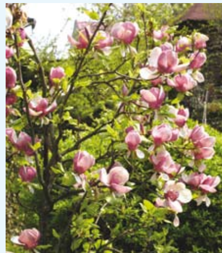
Magnolia Rustica Rubra

Od ul. 3 Maja widoczne jest drzewko rzadko spotykanej magnolii pośredniej odmiany